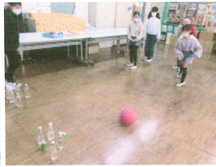
ペットボトルボーリング