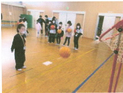
吉子川フリースロー